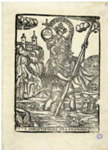
Gravat de Sant Cristòfol, atribuït a Isabel Jolis

La Biblioteca de Catalunya conserva un important fons d'estampes i matrius xilogràfiques de la Casa Jolis-Vda. Pla, adquirit per compra l'any 1987 a la família Dalmases Bocabella, hereus de la impremta de la Vda. Pla